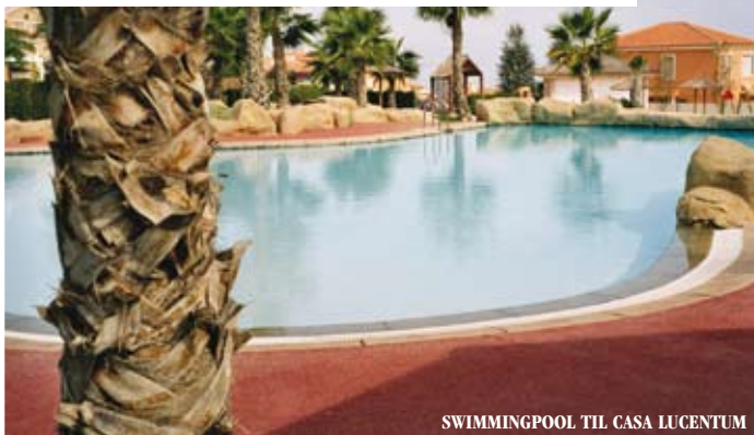
SWIMMINGPOOL TIL CASA LUCENTUM